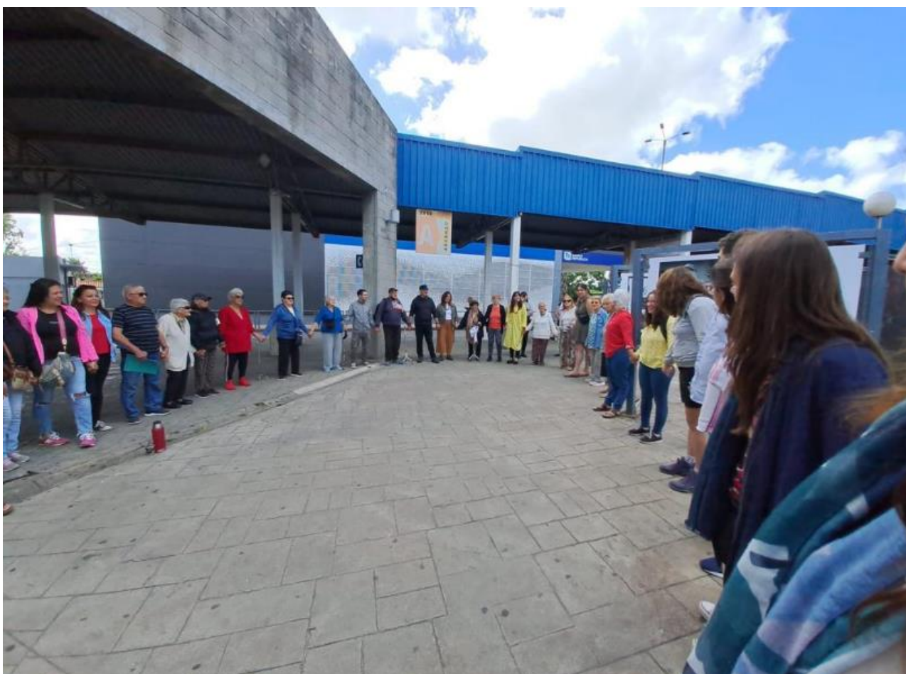
Figura 11 Inauguración de la fotogalería - Diciembre 2022.