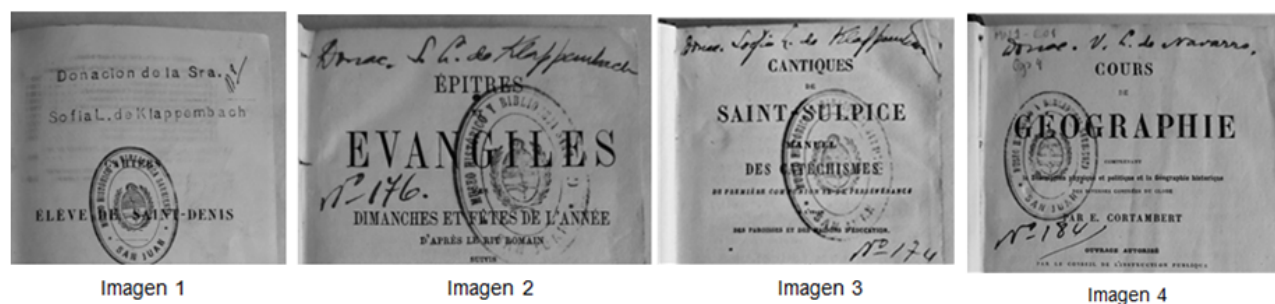
Figura 3 Modelos de ex donos

Fuentes: Imagen 1: ex dono tipo sello de Sofía Lenoir de los libros inventariados del 9 al 15, de la colección Cahiers d'une élève de Saint-Denis . Imágenes: 2 y 3: variantes de los ex donos manuscritos de Sofía Lenoir, de asientos nro. 174, Epitres et Evangiles des dimanches et fêtes de l'année [...], y del nro. 176, Traité pratique et raisonné de grammaire anglaise [...]. Imagen 4: ex dono de Victorina Lenoir de Navarro, correspondiente al asiento nro. 184, Cours de géographie [...], del Inventario de libros donados.