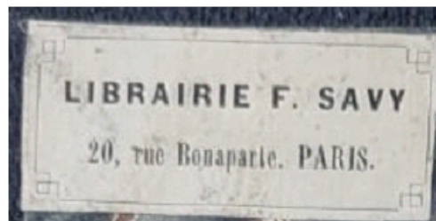
Figura 2 Marca de librero

Fuente: Colección Cahiers d'une élève de Saint-Denis, cours d'études [...], Baudet, L. (1858-1859).