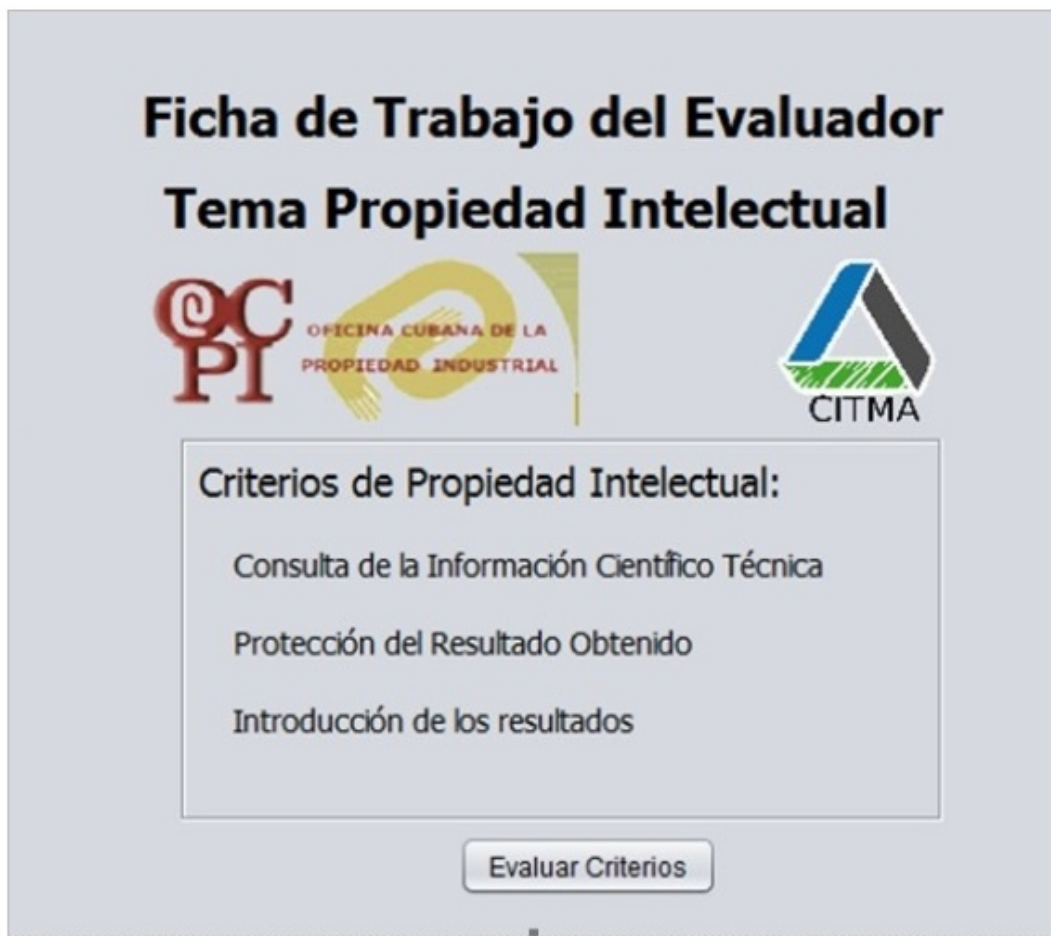
FIGURA 2. Herramienta de evaluación de la PI para proyectos de I+D+i.

Así mismo, esta herramienta posibilita el establecimiento de tres criterios fundamentales (como se muestra en las figuras 3, 4 y 5), los cuales por su incidencia en esta esfera de actividad permiten agrupar las acciones definidas en la metodología propuesta en estudio anterior (Martínez Domínguez, 2007), de manera que exista correspondencia entre la ficha del evaluador vigente y el método que se pretende introducir, desarrollando así una adecuada gestión de la PI en el tránsito paralelo al ciclo de vida de los proyectos de ciencia, tecnología e innovación, con incidencia en la mejora del Sistema de Programas y Proyectos a nivel territorial con el uso adecuado de las Tecnologías de la Informática y las Comunicaciones.